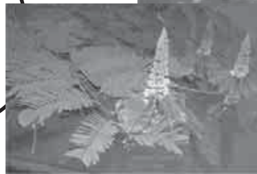
Atas: Anggrung Kiri: Kaliandra

Lutung sedikit sekali memerlukan air untuk minum karena kebutuhan air hariannya sudah terpenuhi dari daun dan buah-buahan yang dimakannya.